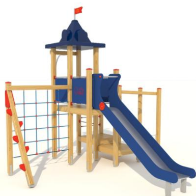
4.04a Pirat z siatką