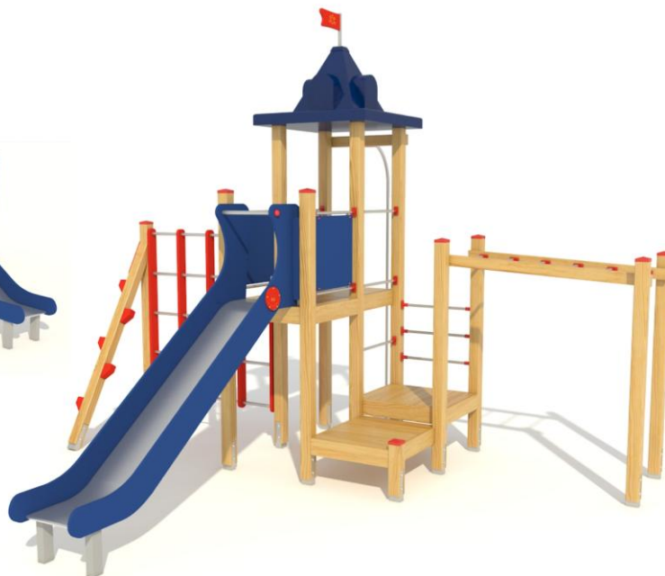
4.04a Pirat z kratą drewnianą

Przedstawione wzory urządzeń mogą nieznacznie odbiegać od aktualnie produkowanych przez naszą firmę, ponieważ wciąż staramy się wytwarzać urządzenia o coraz wyższym standardzie i dokonujemy pewnych modyfikacji.