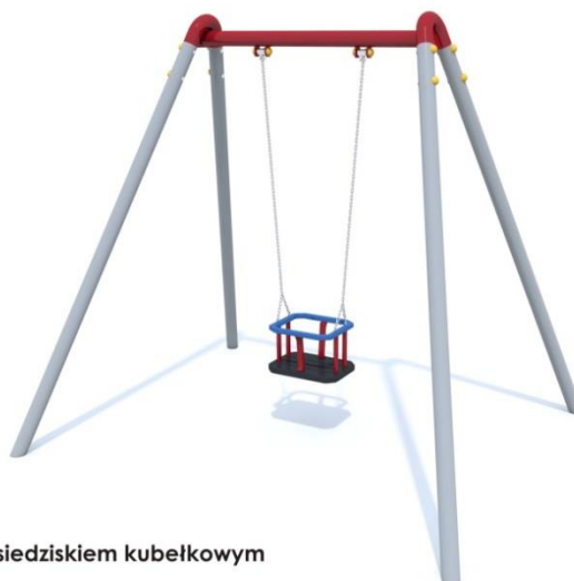
PM 1102 Huśtawka pojedyncza z siedziskiem kubelkowym

* Karta techniczna nie stanowi oferty handlowej w rozumieniu art. 66 par.1 Kodeksu Cywilnego, zawarte dane mają charakter tylko informacyjny.