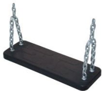
PM 1101 Siedzisko gumowa deseczka