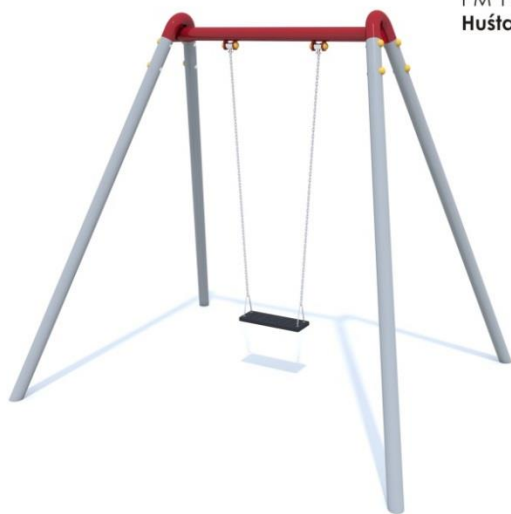
PM 1101 Huśtawka pojedyncza z siedziskiem gumowym