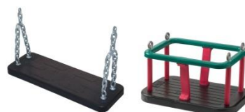
PM 1113 MIX siedzisk (gumowa deseczka + kubek)