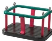
PM 1112 Siedzisko kubekowe (siedzisko dla dzieci najmłodszych)