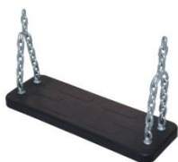
PM 1111 Siedzisko gumowa deseczka